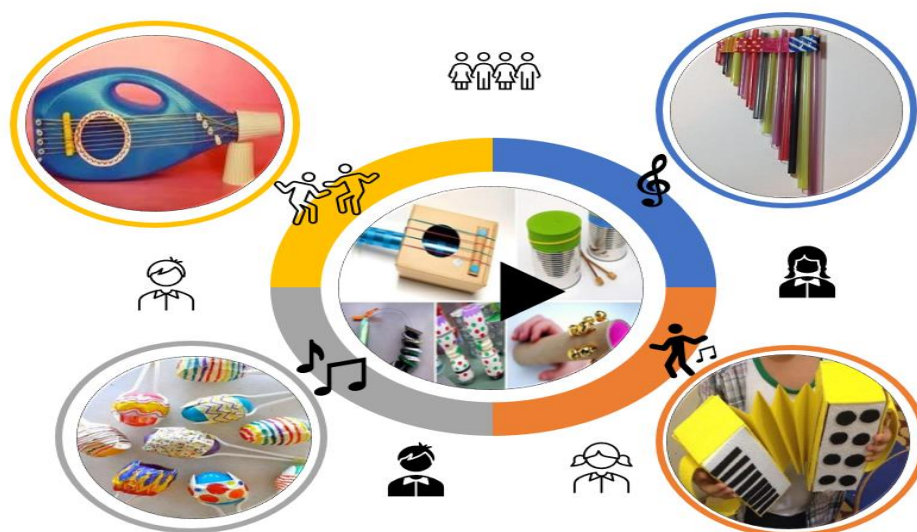
Figura 2: Instrumentos Musicais e o estímulo musical a partir de Sucatas